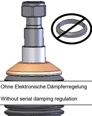
Ohne Elektronische Dämpferregelung Without serial damping regulation

Original Stützlager ohne den serienmäßigen Faltenbalg (Staubschutz) aufstecken und mit der mitgelieferten Stopmutter verschrauben. Das Anzugsdrehmoment der Kolbenstangenbefestigung beträgt 50 Nm. Die Montagehinweise zum Einbau des Federbeines in das Fahrzeug, sowie die Anzugsdrehmomente der Federbeinbefestigung, entnehmen Sie bitte den Unterlagen des Fahrzeugherstellers.